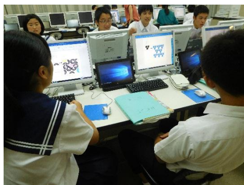
【美術：和模様をワードで創作】