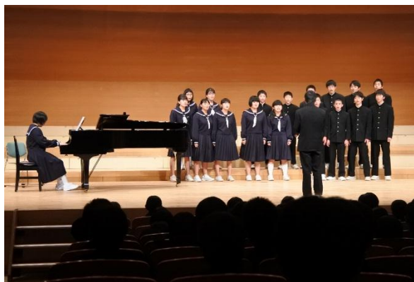
篠山市中・特別支援学校 音楽弁論大会

あたりまえのこと、ささいなことでも徹底してやり切ると大きな力になる。2学期もあと3週間余りとなりました。様々な行事や教育活動を乗り越えた学級の協力や一人一人の成長、学習の定着などを振り返り、新年を迎えたいと思えます。