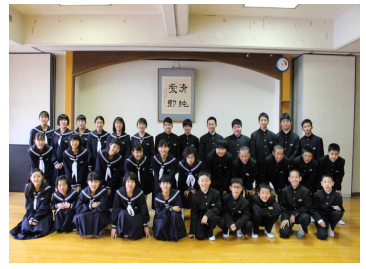
入学式後、34名でパチリ！

あいにくの春の嵐となりましたが、入学式を行い、34名の新生が入学。1年生34名、2年生30名、3年生47名の合計111名で平成31年度がスタート！1学期が始まって約3週間が経過。各学年では今年度の目標やテーマを設定。新しい先生、新しい友達との出会い。フレッシュな4月の気持ち・意気込みを忘れないで下さい。入学式の式辞でもお願いしましたが、「学習方法の確立」「チャレンジする心」「思いやりのある優しい心」を忘れず、何事にも「一生懸命」の姿を大切にして下さい。