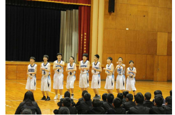
バスケット部のパフォーマンス！

6校時、1年生に対しての部活動紹介を開催。本校7つの部が、約5分間の時間を有意義に使い、1年生に入部を呼びかけました。各部とも、工夫を凝らした演出で、1年生の心をゲット！素晴らしい部活動紹介の時間となりました。当然、教室での学習は大切です。しかし、単に教室だけの授業では学べないこと、教室以外で学ばなければならぬことは、いっぱいあります。各部の熱い活動・熱い思いを期待しています。