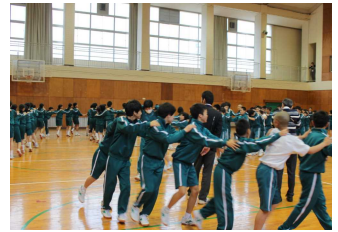
異様に盛り上がったジャンケン列車

6校時、生徒会の主催で、恒例の新入生歓迎会を開催！新入生入場の後、「自己紹介ゲーム」に始まり、「ドッジボール！新入生を守れ！」まで、6種類のゲーム・クイズに学年の枠を超え、111名は熱狂しました。生徒会執行部の、ユーモアあるスムーズな進行。全校生一人一人の笑顔と気遣い。素晴らしい学校・素晴らしい生徒たちを実感しました。西紀中学校生の今後の更なる活躍と成長を大いに期待します！自立と実践力！！