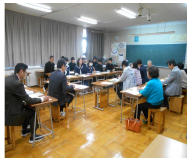
第2回「四つの力委員会」

その後の学校運営協議会では、学校側より、「1学期後半から2学期前半の学校・生徒・教職員の状況」「学力学習状況調査結果について」「学校中間評価について」の説明をし、学校運営・教育活動等についての、多くの意見やアドバイスを頂きました。そして、今年度後半の、学校運営協議会の事業を確認して終了しました。「社会に開かれた教育課程」を実践して頂き、生徒たちに、地域貢献やボランティア活動の貴重な機会を提供して頂いている学校運営協議会の皆様に感謝申し上げます。