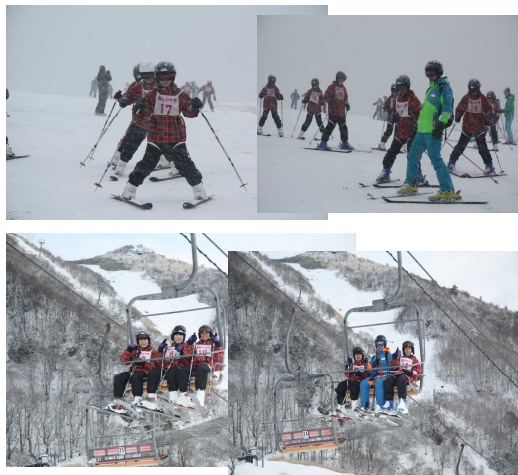
白銀の世界を満喫！

2泊3日の間、誰一人スキー実習を休むこともなく、熱を出して寝込む生徒もなく、全員が元気に参加。学年の絆は更に深まり、スキー以外の目的・ねらいもしっかりと達成できた、本当に素敵なスキー学校となりました。