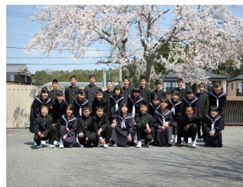
入学式後、29名でパチリ！

時間的にも内容的にも短縮した形とはなりましたが、入学式を行い、29名の新入生が入学。1年生29名、2年生34名、3年生30名の合計93名で令和2年度がスタート！1学期早々の臨時休業措置。しかし、登校日には、各学年で、今年度の目標やテーマを設定。新しい先生、新しい友達との