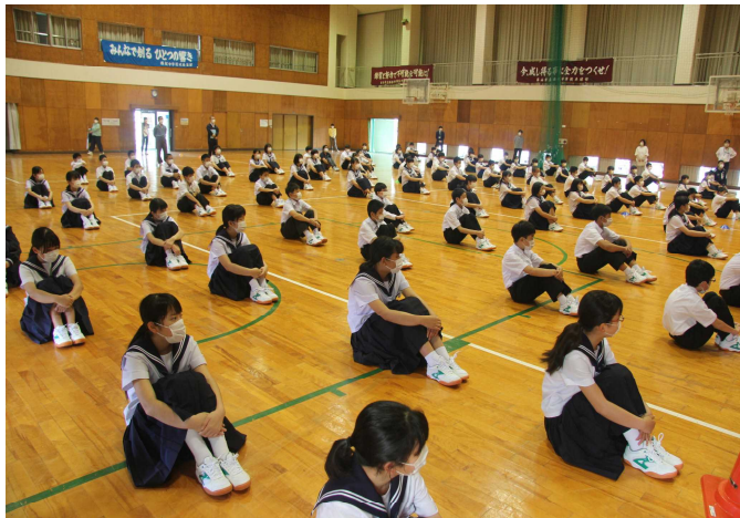
6 / 1 間隔をとっての全校集会

目標達成に対する方法や手段を明確にアドバイスしてやること。教えてやること。そして、その達成感を体験させてやること。 よって、具体的な学習の方法をアドバイスしてやることも、生徒の進路の目標を達成するための、1つの手段・方策なのです！