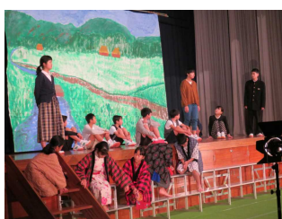
1年「ユタと不思議な仲間たち」