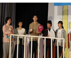
2年「グッドバイ・マイ・・・」 3年「青空につづる手紙」