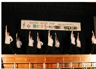
生徒会オープニング