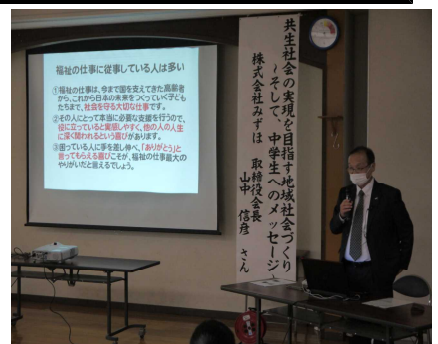
山中先生からの熱きメッセージ

本年度、本校は県教育委員会から「プロから学ぶ創造力育成事業」の指定を受けています。「変化が激しく、グローバル化が進む世界において、日本が国際社会で他国と協調しつつ、世界をリードする役割を果たすためには、卓越した創造力や発想力、確かな技術力が大切である。そこで、様々な分野で世界的に活躍する兵庫ゆかりのクリエイターを学校へ招聘し、中学生を対象に講話や実演を行うことで、これからの社会において、より豊かな感性を働かせ、新たなアイデアを生む力を身につける機会を支援する。」を趣旨とする、キャリア教育の推進です。