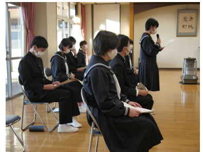
「四つの力委員会」生徒会提言

今年度は、各種のボランティア活動等がコロナ禍において、ほぼストップ。計画通りの活動が出来ていませんが、「学校・家庭・地域の連携強化」「社会に開かれた教育課程」の実践を目指して取り組みを更に続けていきます。