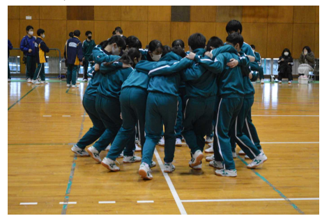
三送会 3年生の退場！