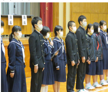
生徒会新旧交代セレモニー