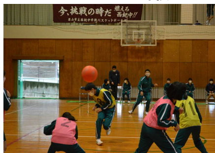
三送会 盛り上がったクイズ大会！