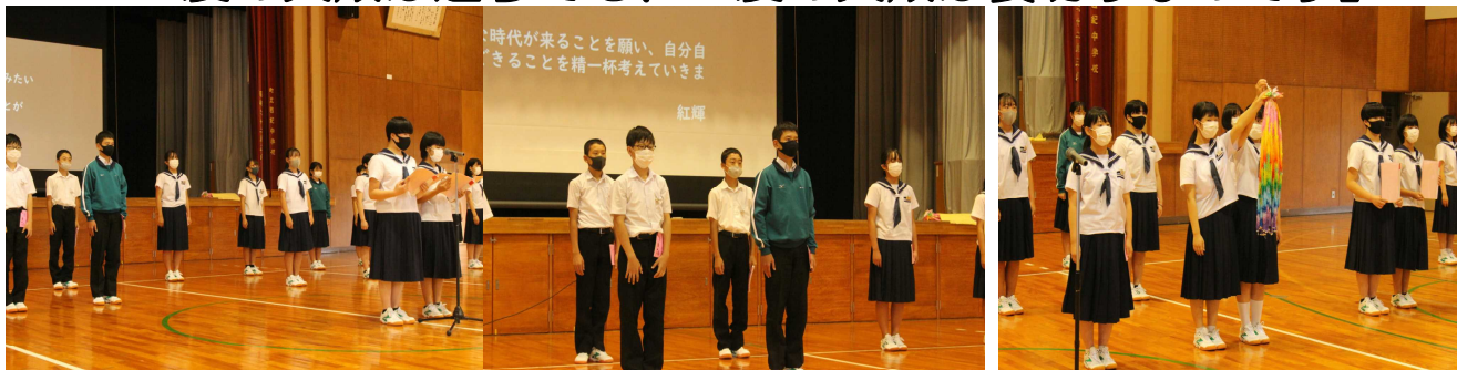
3年生による平和宣言文朗読！