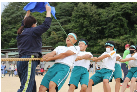
綱引き 優勝の青ブロック